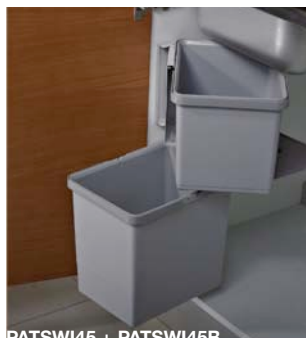
PATSWI45 + PATSWI45B